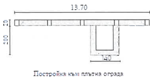
(фиг. 3) Плътна ограда и постройка към нея.