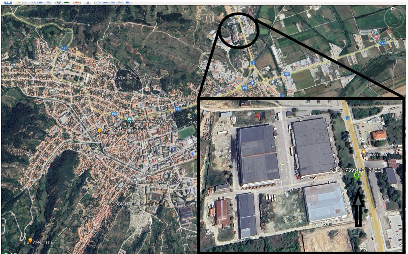
Фиг. 1 Местоположение на новото водовземно съоръжение.

Инвестиционното предложение не засяга защитени територии по смисъл на Закона за защитените територии (обн. ДВ, бр. 133/11.11.1998 г.), както и защитени зони по смисъла на Закона за биологичното разнообразие (обн. ДВ, бр. 77/ 09.08.2002 г.) от Националната екологична мрежа.