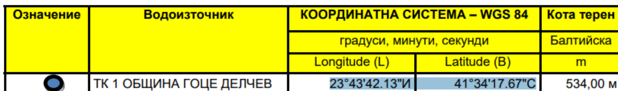
Таблица 1. Географски координати на сондажа.

Проектния тръбен кладенец ще се реализира в УПИ XIV 17395.501. 2460, гр. Гоце Делчев, община Гоце Делчев, област Благоевград Фиг. 1. Тръбния кладенец се предвижда да бъде разположен източната част на имота. Приблизителните географски координати на кладенеца в имота са както следва: 23°43'42.13"И 41°34'17.67"С.