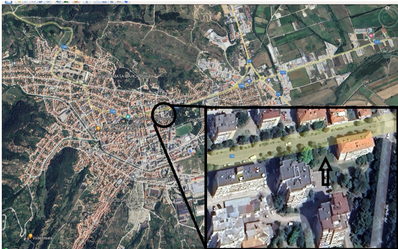
Фиг. 1 Местоположение на новото водовземно съоръжение.

Инвестиционното предложение не засяга защитени територии по смисъл на Закона за защитените територии (обн. ДВ, бр. 133/11.11.1998 г.), както и защитени зони по смисъла на Закона за биологичното разнообразие (обн. ДВ, бр. 77/ 09.08.2002 г.) от Националната екологична мрежа.