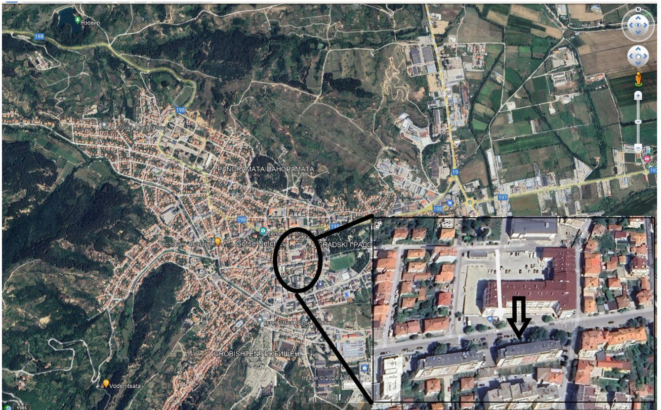
Фиг. 1 Местоположение на новото водовземно съоръжение.

Инвестиционното предложение не засяга защитени територии по смисъл на Закона за защитените територии (обн. ДВ, бр. 133/11.11.1998 г.), както и защитени зони по смисъла на Закона за биологичното разнообразие (обн. ДВ, бр. 77/ 09.08.2002 г.) от Националната екологична мрежа.