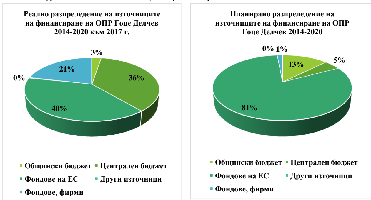
Фигура 2. Основни източници на финансиране на ОПР 2014-2020 до 2017 г.

Графично основните източници на финансиране за периода 2014-2017 г. са представени по-долу.