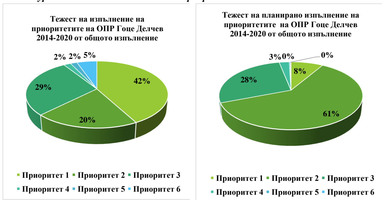
Фигура 1. Финансово изпълнение на приоритети от ОПР 2014-2020 г. до 2017 г.

На фигурата по-долу е визуализирана информацията за вложения финансов ресурс по приоритети на ОПР до 2017 г. и е направена съпоставка с планираното за периода.