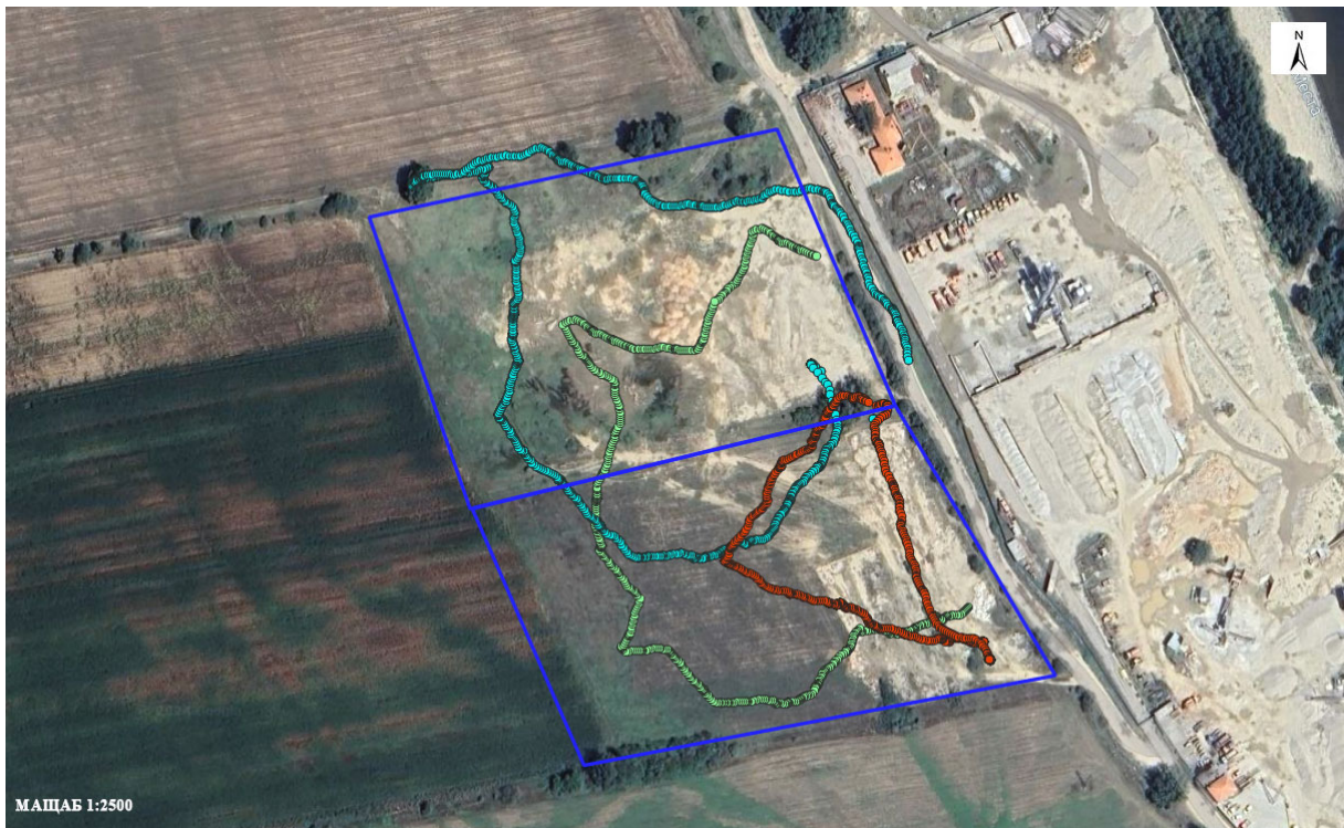
Фигура 3. Карта с местоположението на ПИ 17395.118.3 и 17395.119.4 (със син контур) и тракове от посещенията на терена