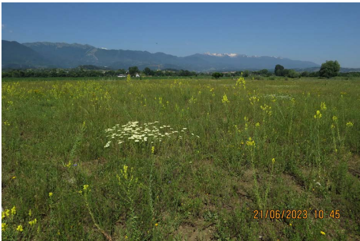
Рудерална растителност в западните части на ПИ 17395.118.3 и 17395.118.4

а) описание и анализ на въздействието на оценяваната промяна върху местообитанията и видовете - предмет на опазване в защитена зона BG0002076 "Места"