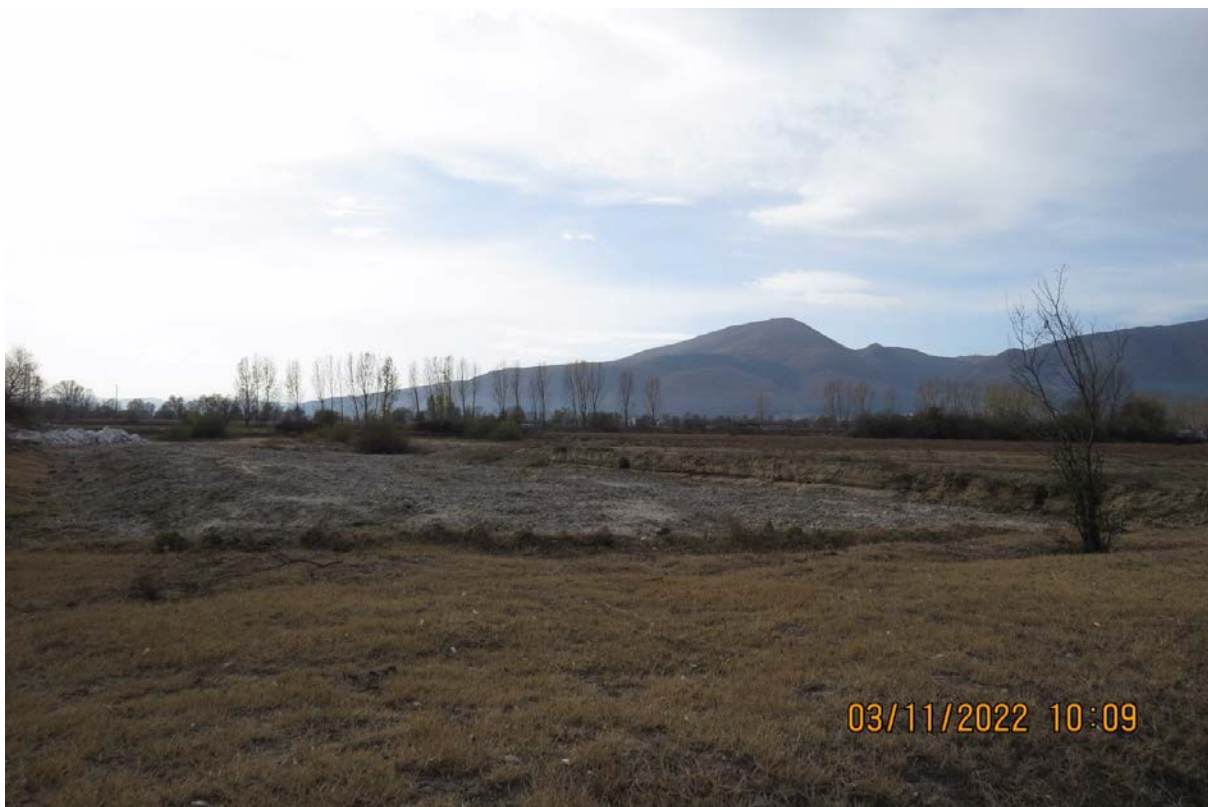
Изглед към източната част на ПИ 17395.118.4