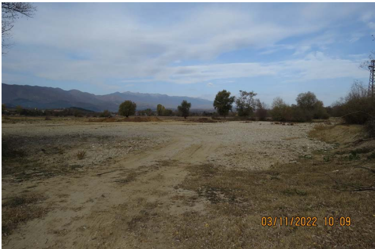
Изглед към източната част на ПИ 17395.118.3

ДОКЛАД за оценка за степента на въздействие на проекти за изменение на Общ устройствен план на община Гоце Делчев за поземлени имоти с идентификатори 17395.118.3 и 17395.119.4, местност „Мочура“ по одобрените кадастрална карта и кадастрални регистри на гр. Гоце Делчев, община Гоце Делчев с цел предвиждане на смесена многофункционална зона - „Смф“ върху защитена зона BG0002076 "Места" съгласно Директива 2009/147/ЕО за опазване на дивите птици Възложител: Община Гоце Делчев