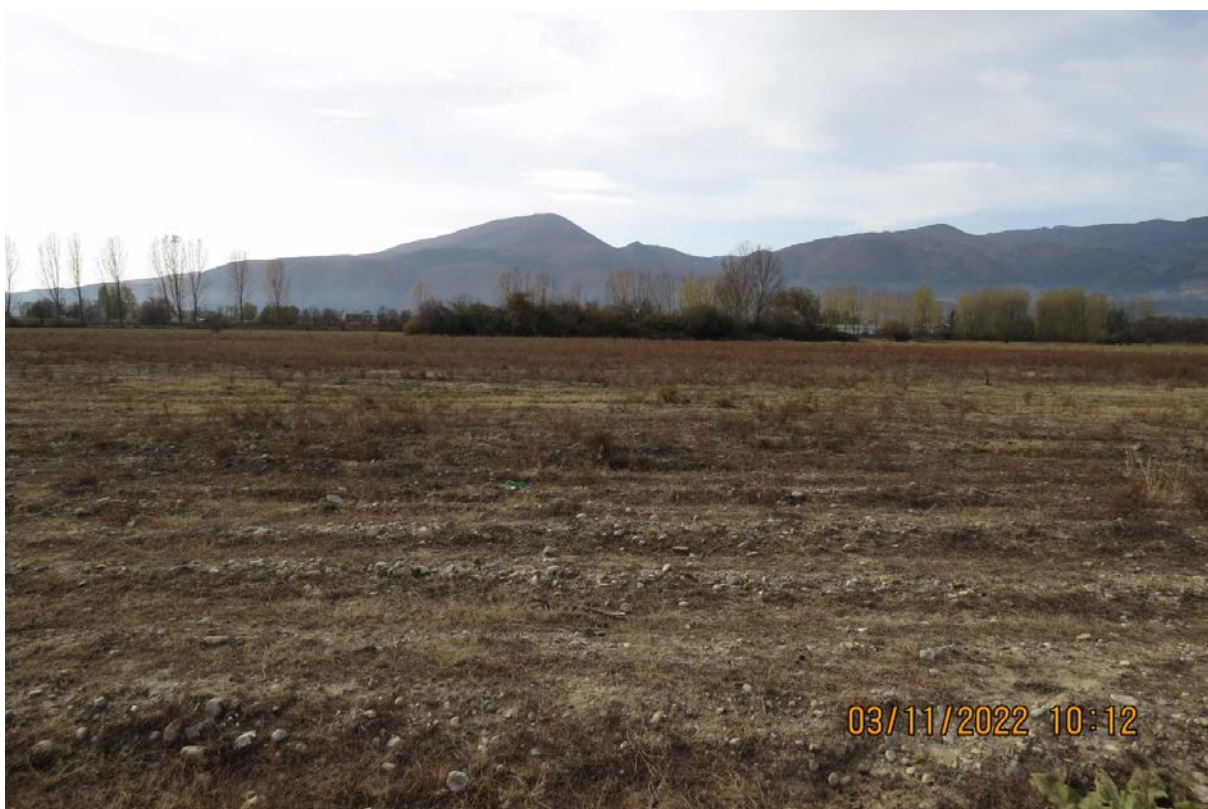
Изглед към западните части на ПИ 17395.118.3 и 17395.118.4

ДОКЛАД за оценка за степента на въздействие на проекти за изменение на Общ устройствен план на община Гоце Делчев за поземлени имоти с идентификатори 17395.118.3 и 17395.119.4, местност „Мочура“ по одобрените кадастрална карта и кадастрални регистри на гр. Гоце Делчев, община Гоце Делчев с цел предвиждане на смесена многофункционална зона - „Смф“ върху защитена зона BG0002076 "Места" съгласно Директива 2009/147/ЕО за опазване на дивите птици Възложител: Община Гоце Делчев