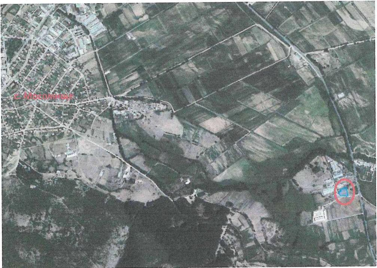
Фигура №1. Обзорна сателитна снимка за района на имота и с. Мосомище

Имота не попада в защитени територии, резервати, площи с обособен вид или ограничен статут на ползване. В близост не са разположени защитени природни обекти, обекти, свързани с национална сигурност, културни и археологични обекти и ценности.